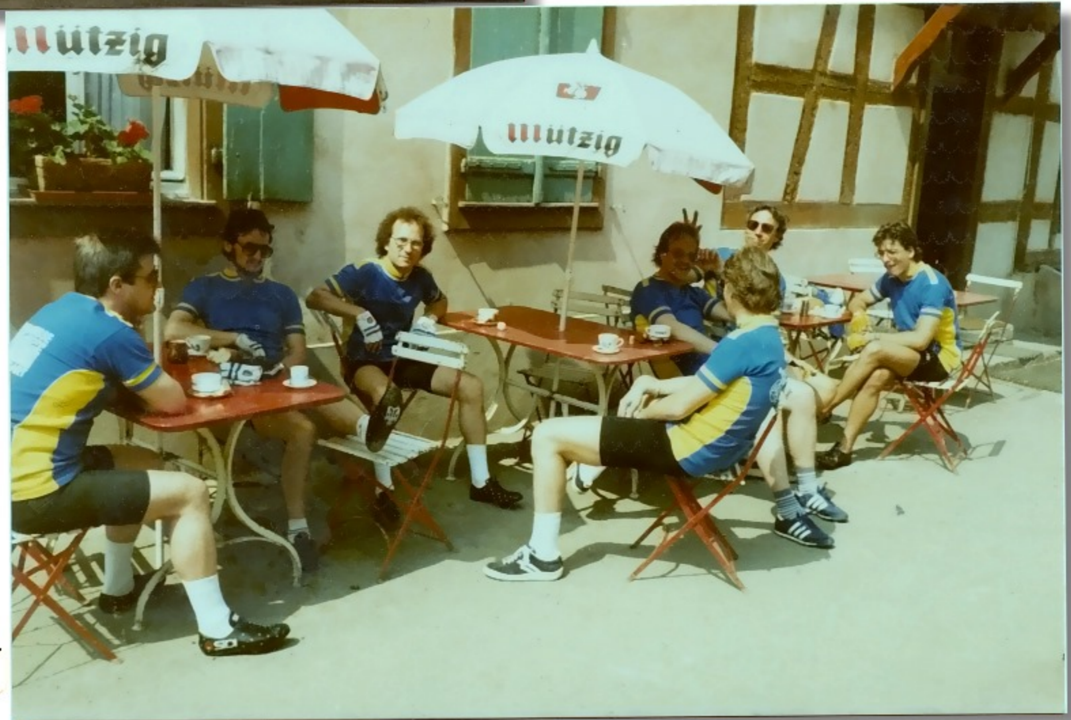
• Vor Hitze kaum noch fahrbereit, aber Bier reguliert's wieder.