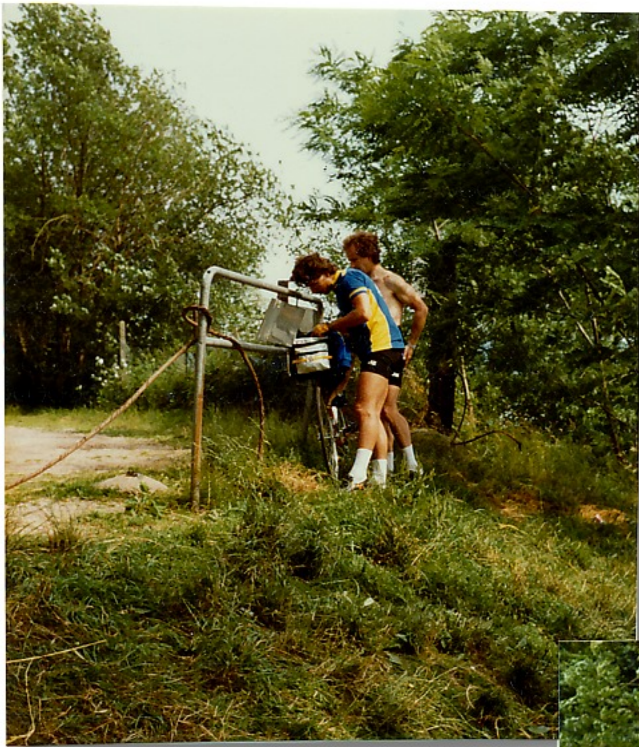
Ein erfrischendes Bad vor dem Tour ende