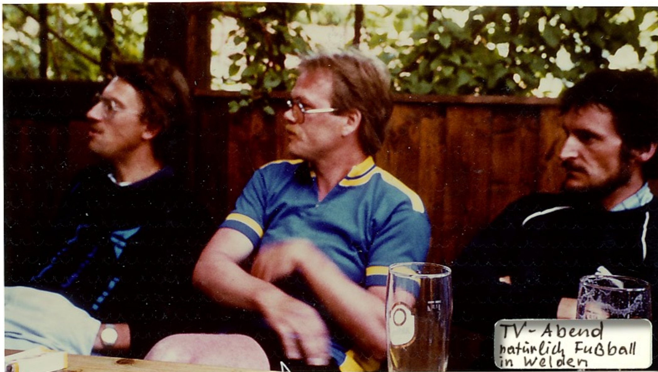
TV-Abend natürlich Fußball in Welden