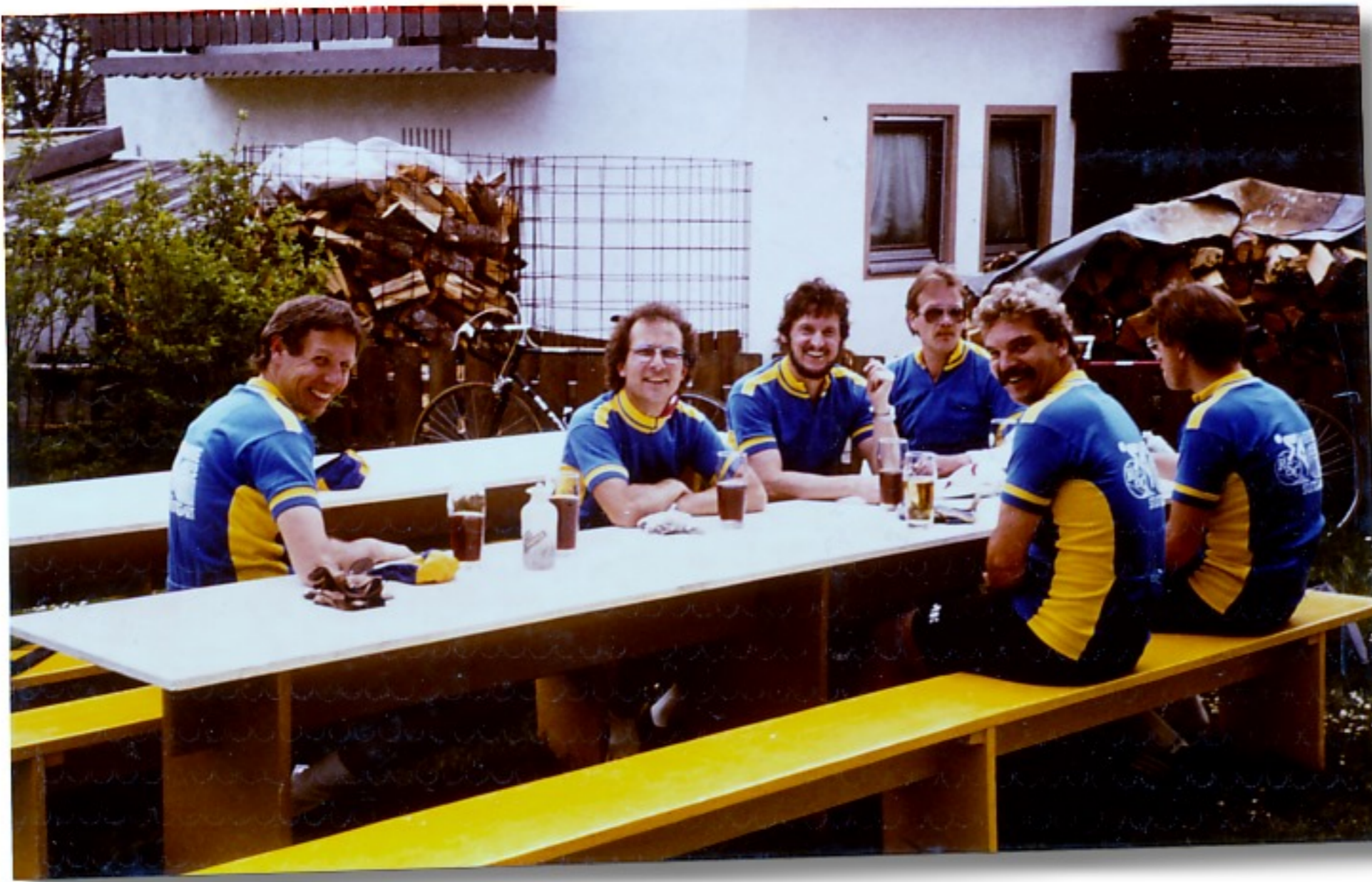
Zwischen den Rastpausen wird natürlich auch gestrampelt.