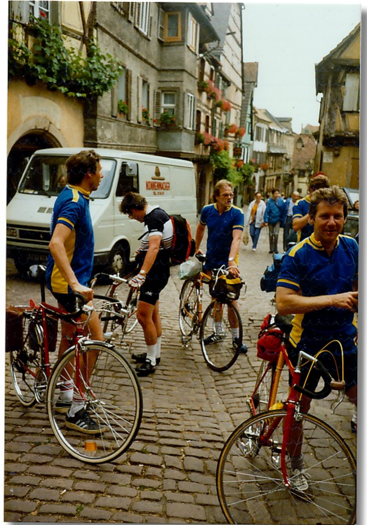
Riquewir das franz. Rothenburg