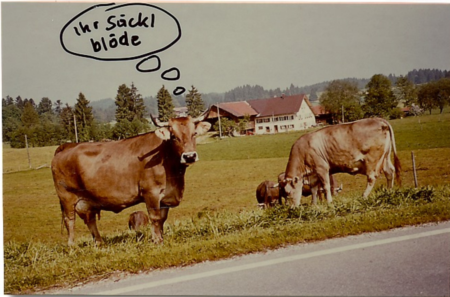
Bei dieser Truppe staunt das Rindvieh