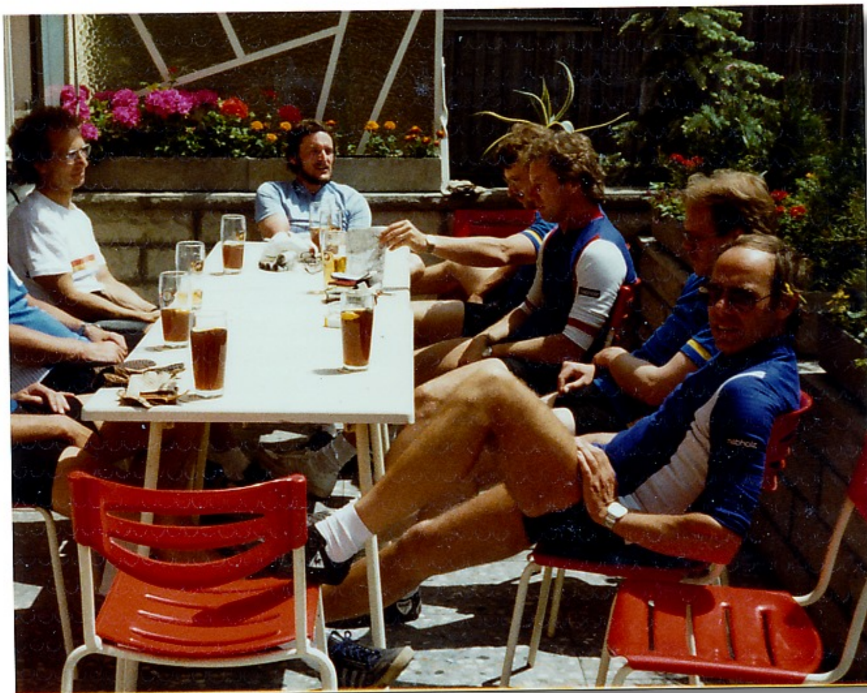
Zum 4000 Kalorien essen unterwegs