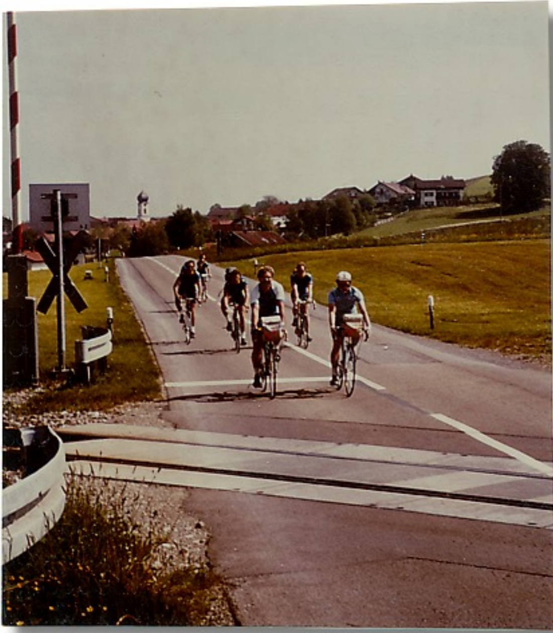
Vorsicht Bahn Kreuzt