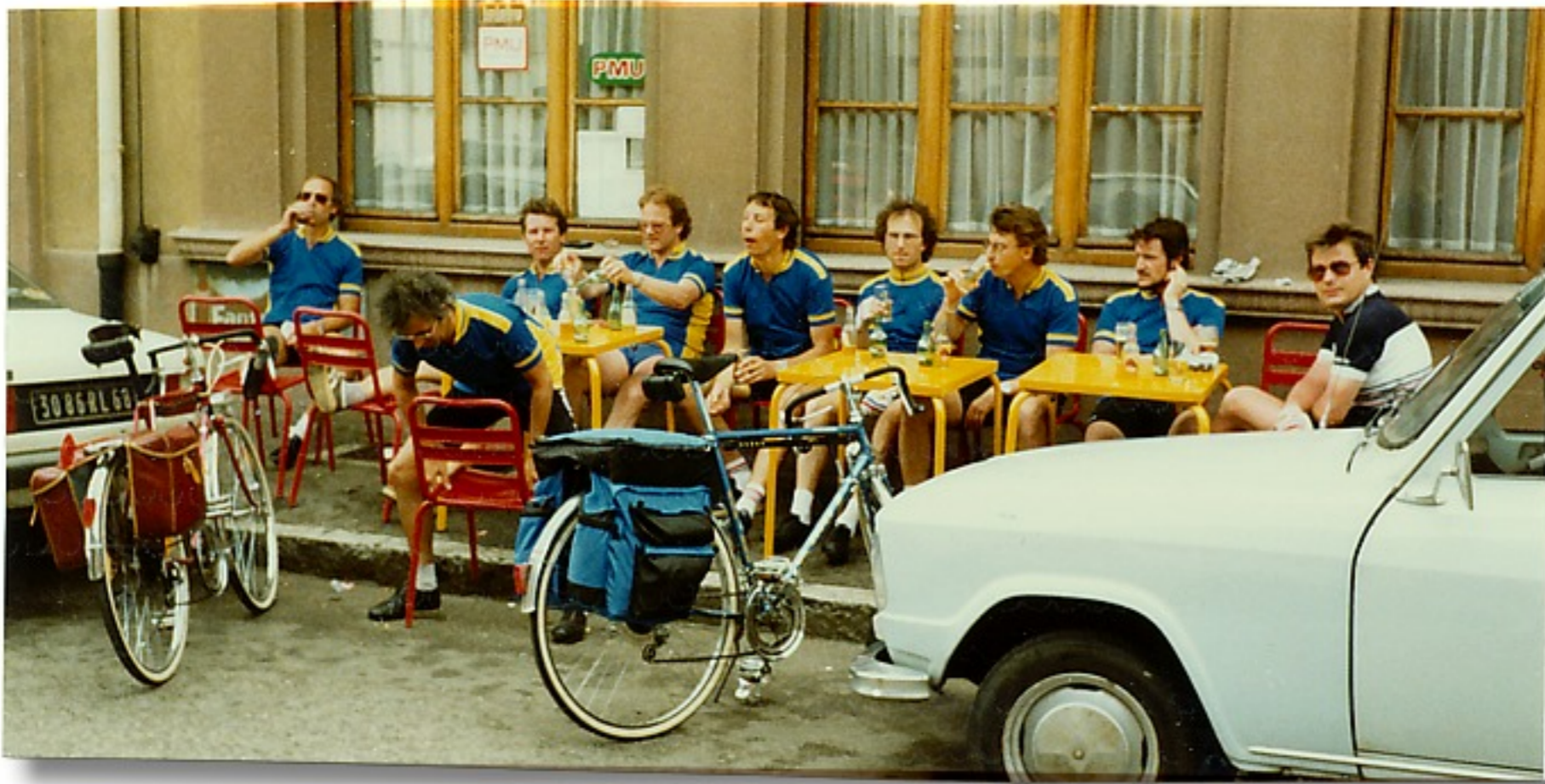
Frühstücken v. der Grenze