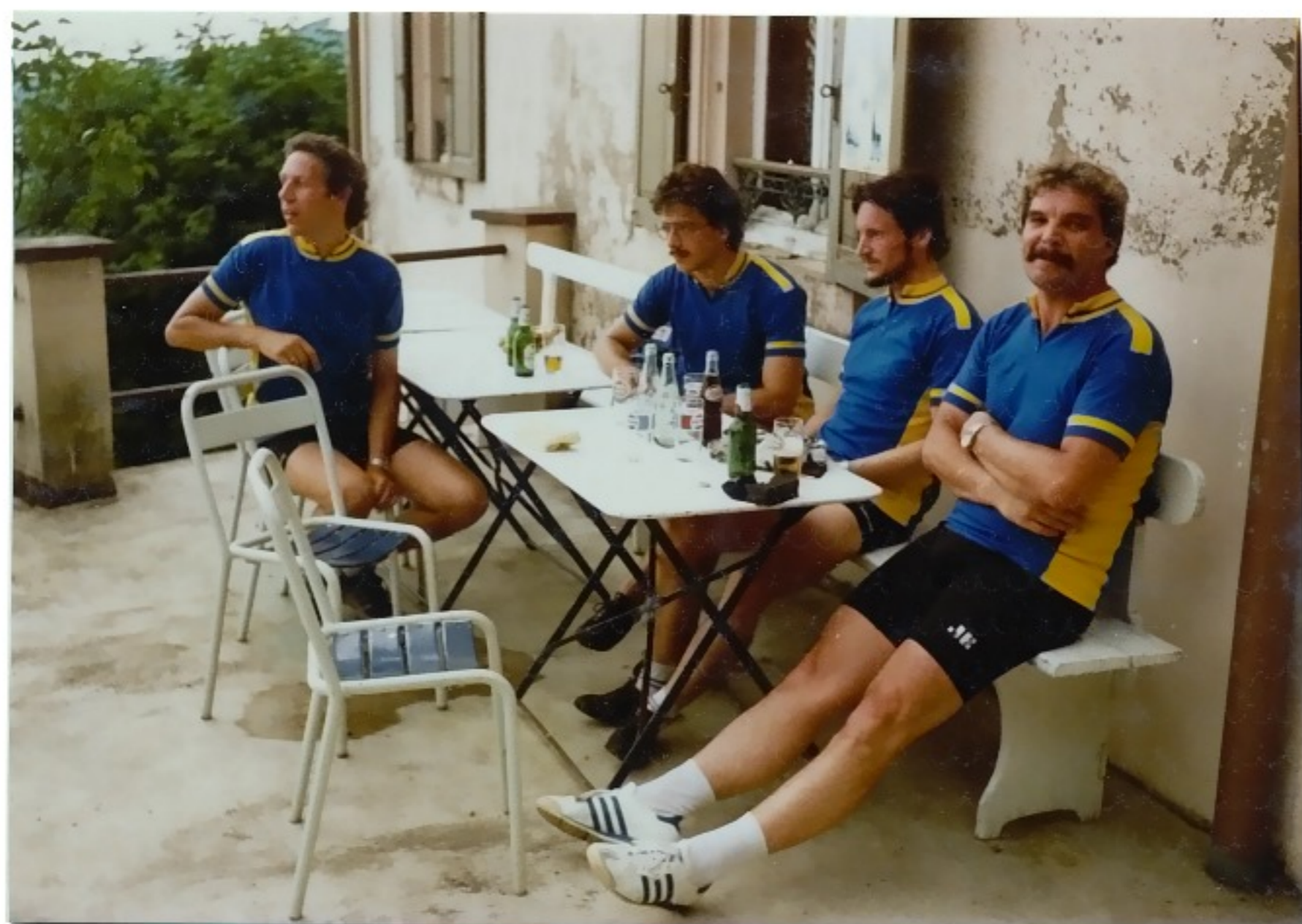
Total erschöpft am Vogesengebiet