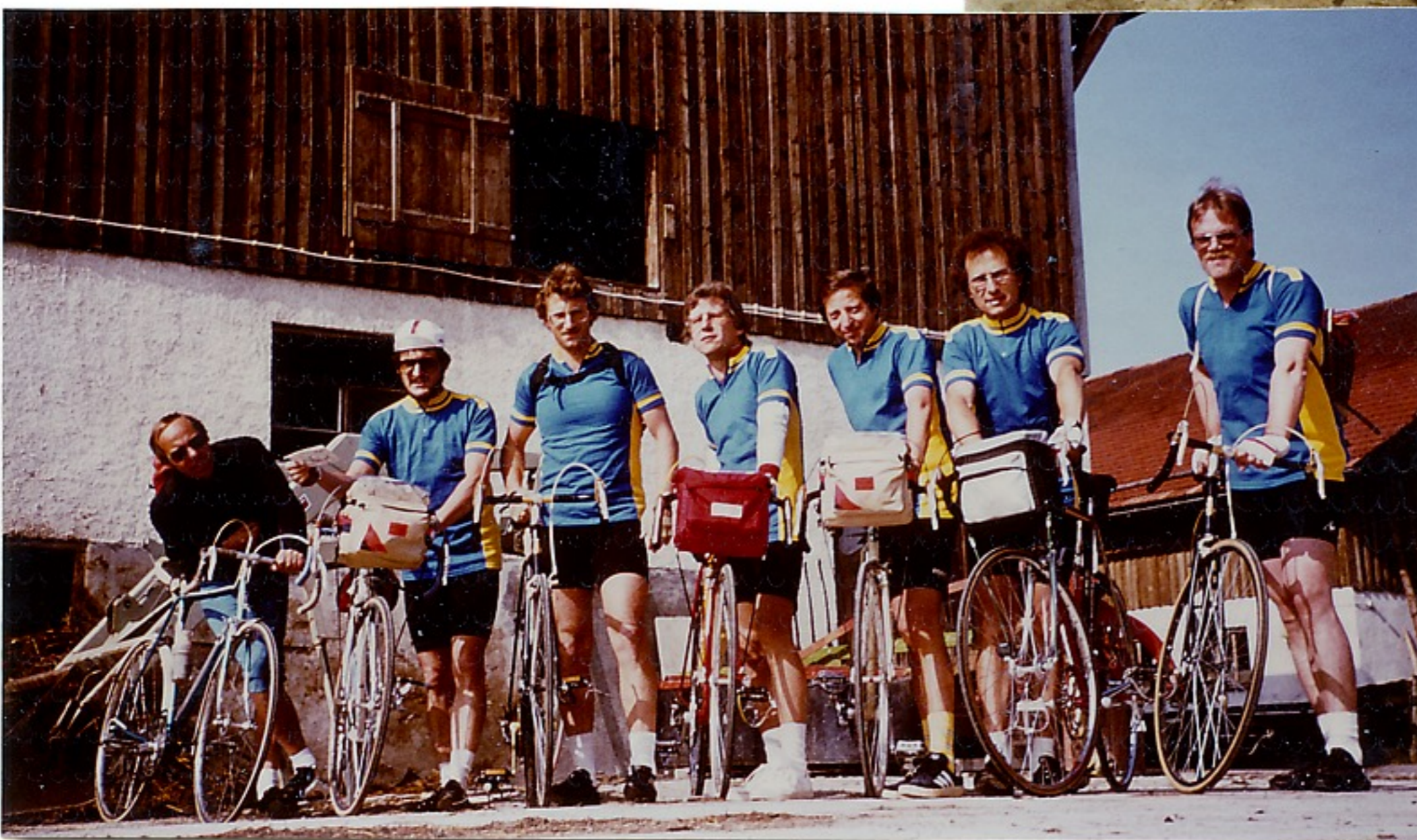
Cinema Scope 3D Aufnahme