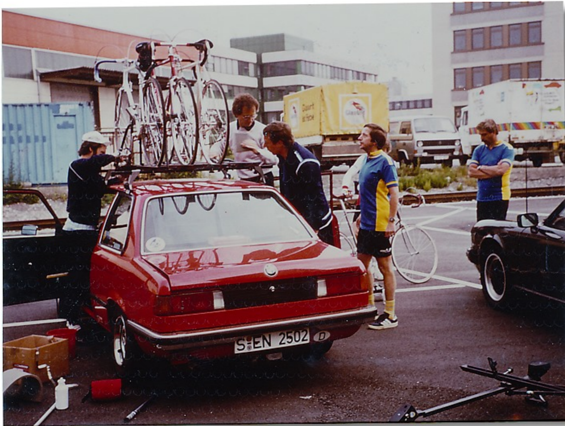
In Stuttgart die Wagen gepackt und ab geht's.