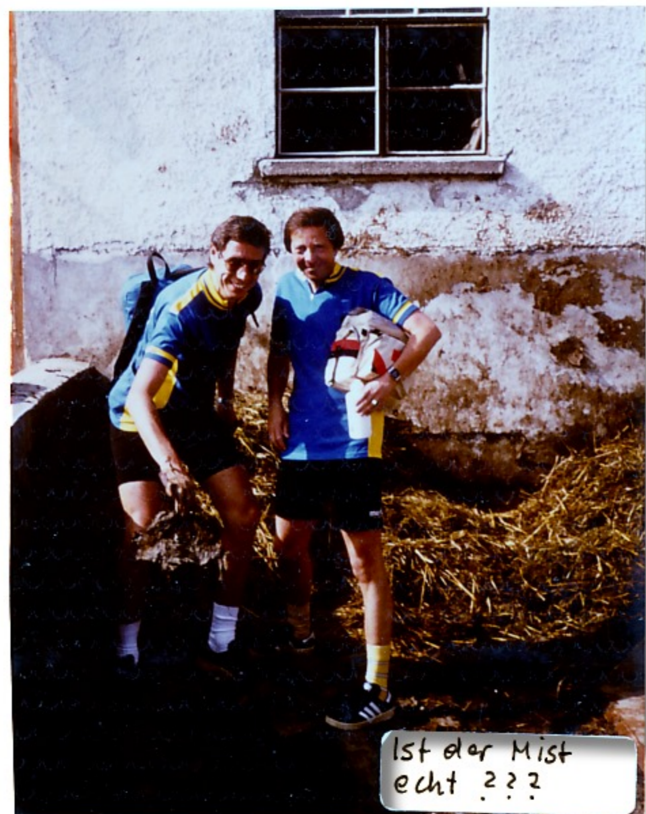
Ist der Mist echt ???