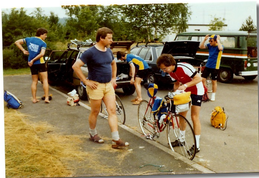
Abfahrt Stuttgart u. Offenburg