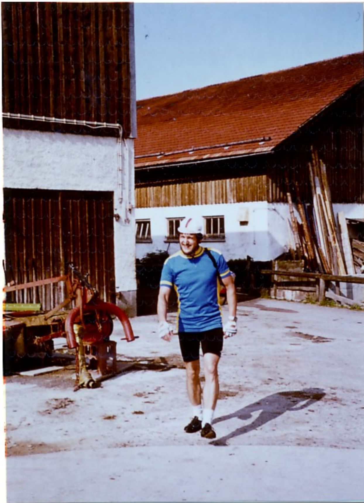
Ankunft am Bauernhof in Nesselwang