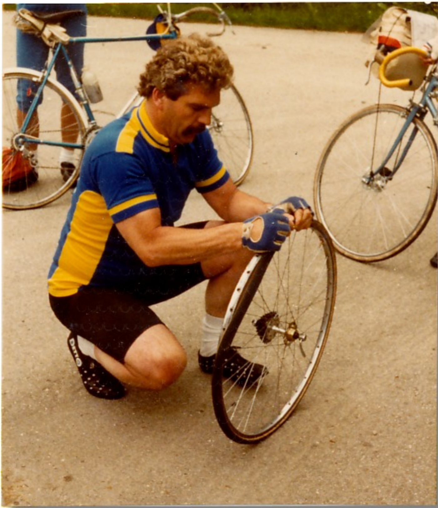
Ohne Panne geht es nicht ....