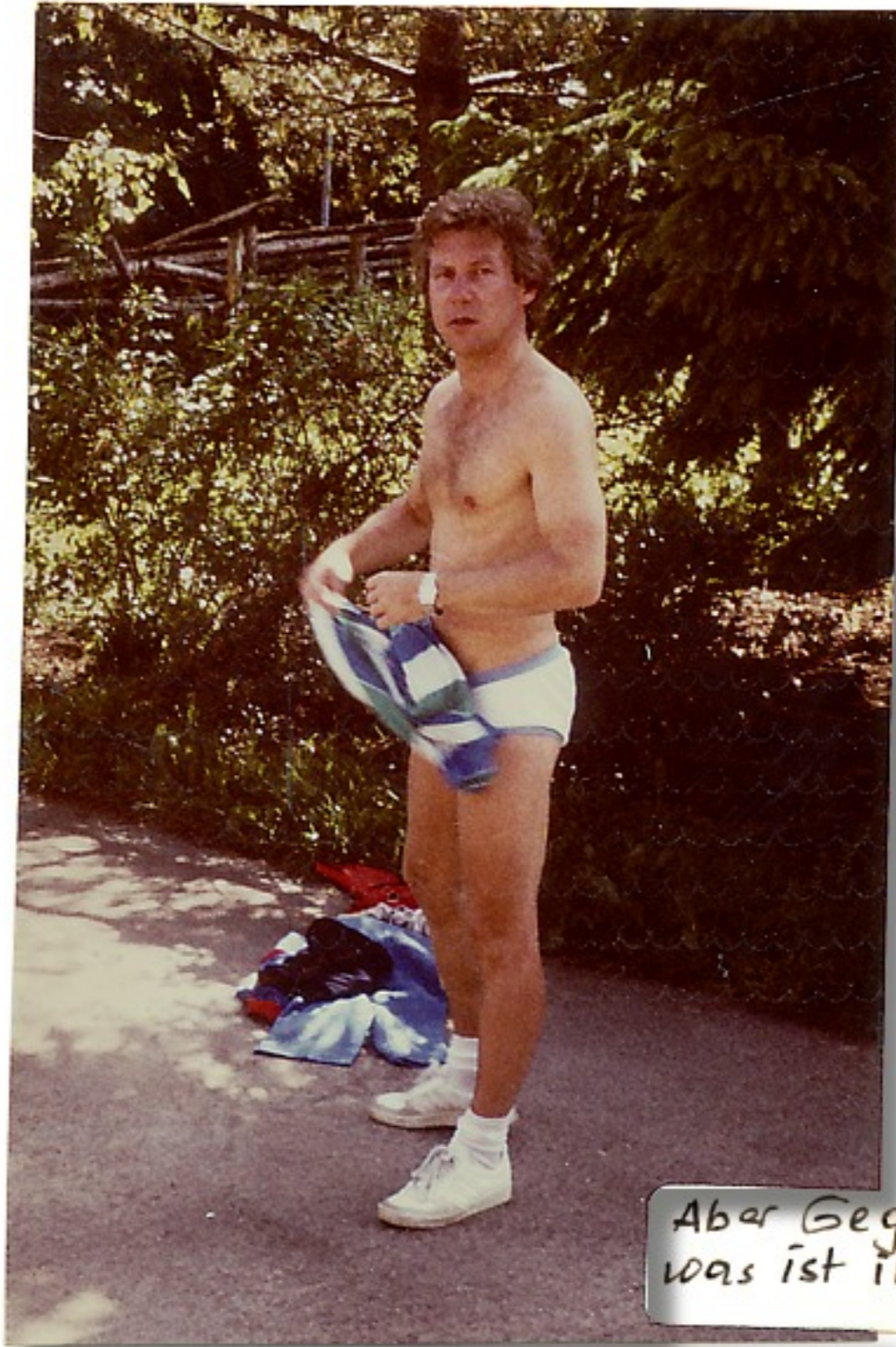
Aber Gege - was ist in Sicht