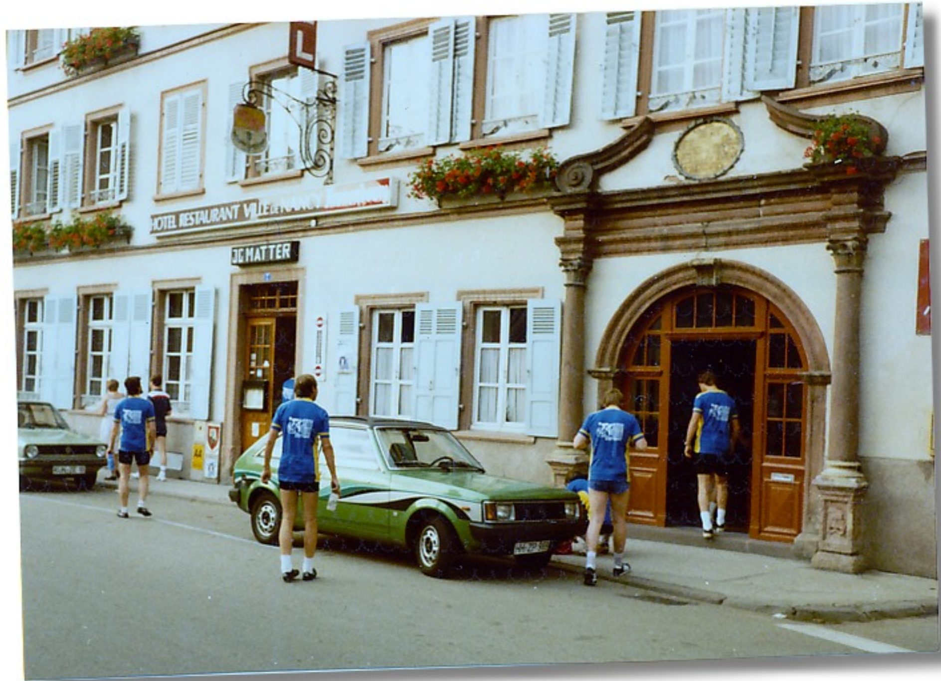
Unser Hotel Nancy