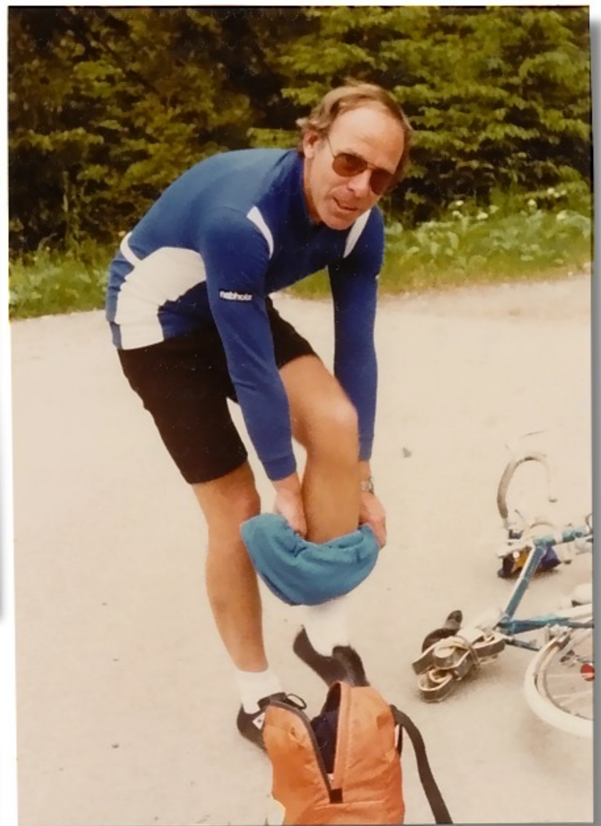
Es wird recht schnell heiß • Zeit zum Strip.