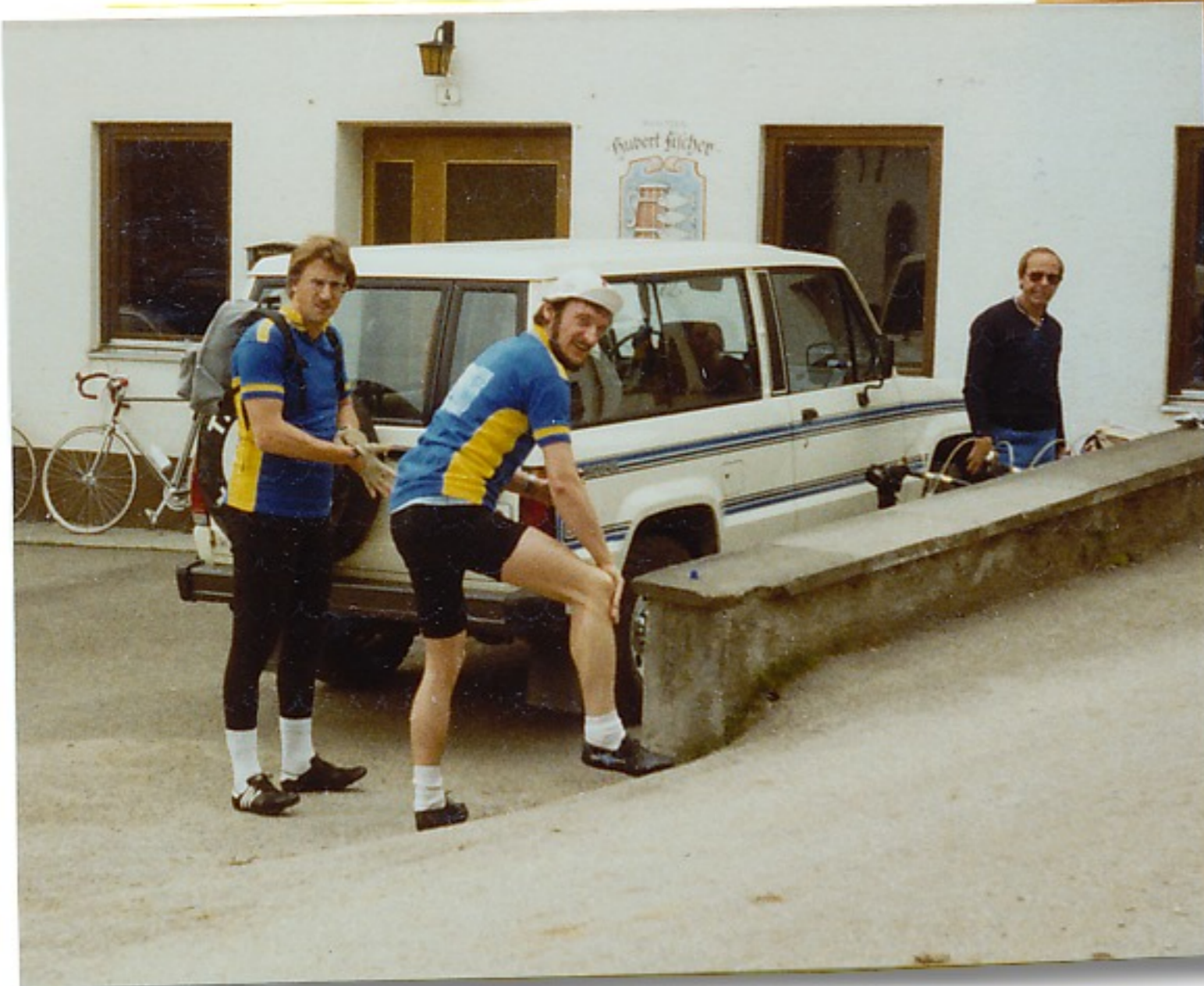
Kräftiges Frühstück i. den Forellenstuben in Welden