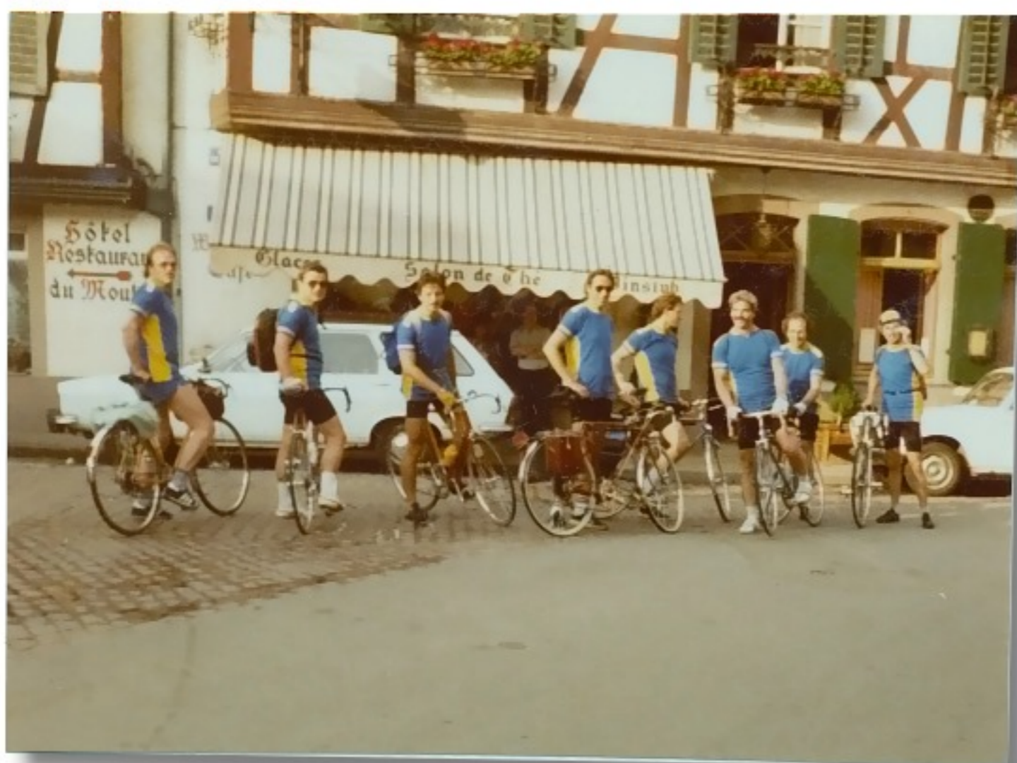
Ankunft in Rippauville