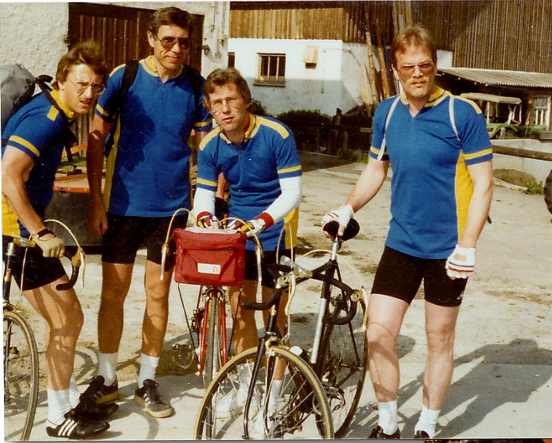
2.Tag - der Super- club fährt ab