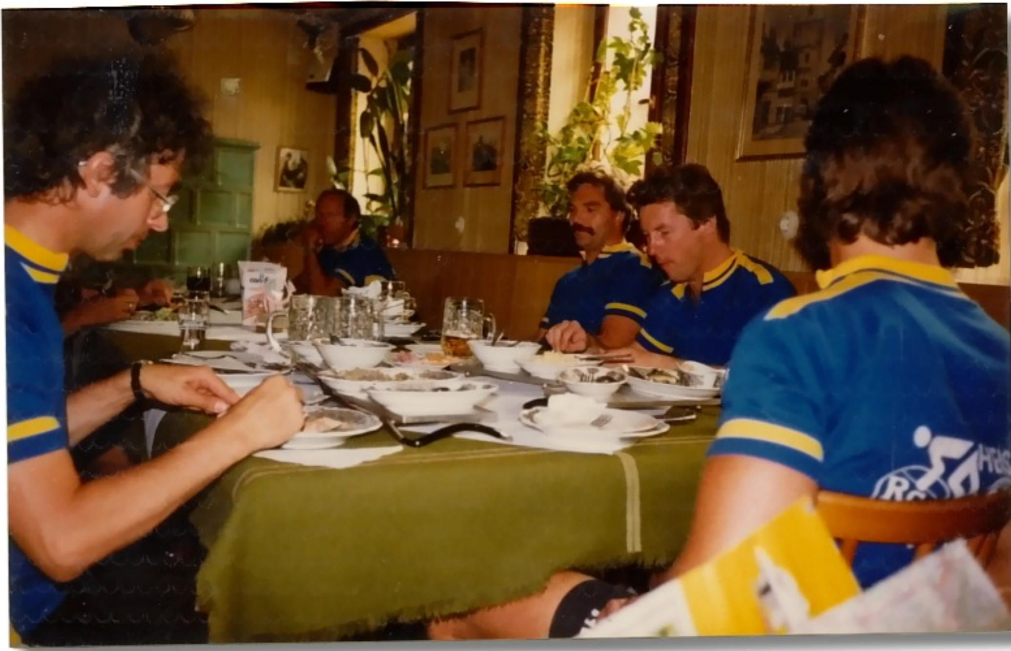
Kräftiges Mittag- essen in Deutschland