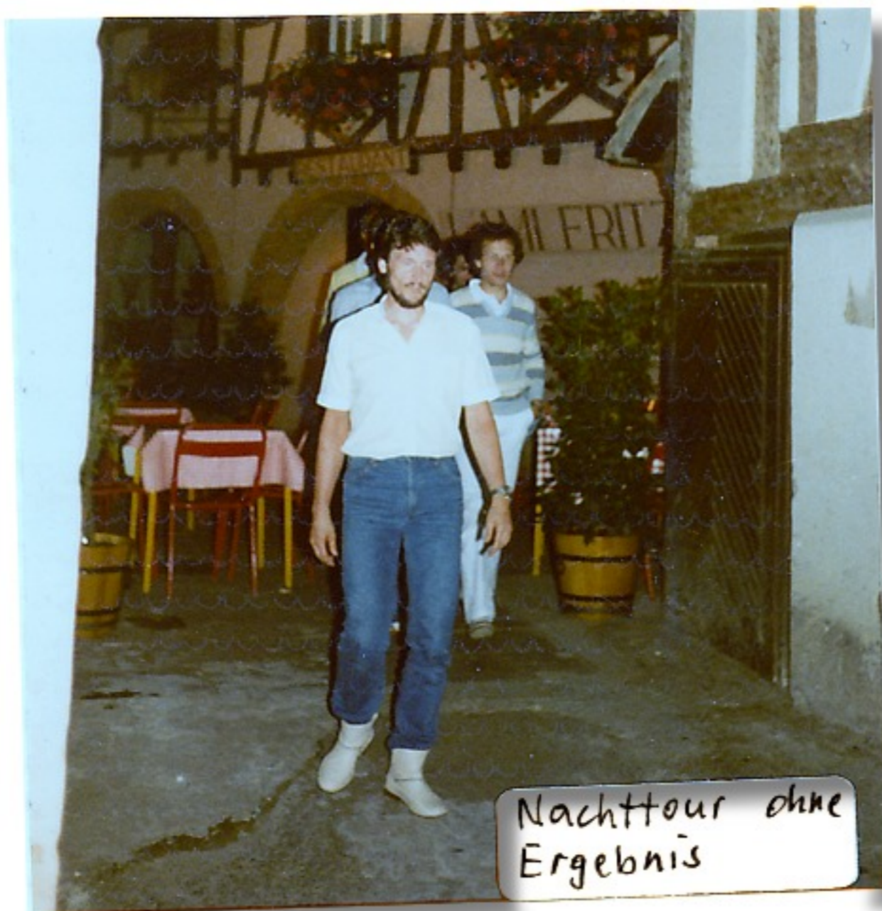
Nachttour ohne Ergebnis