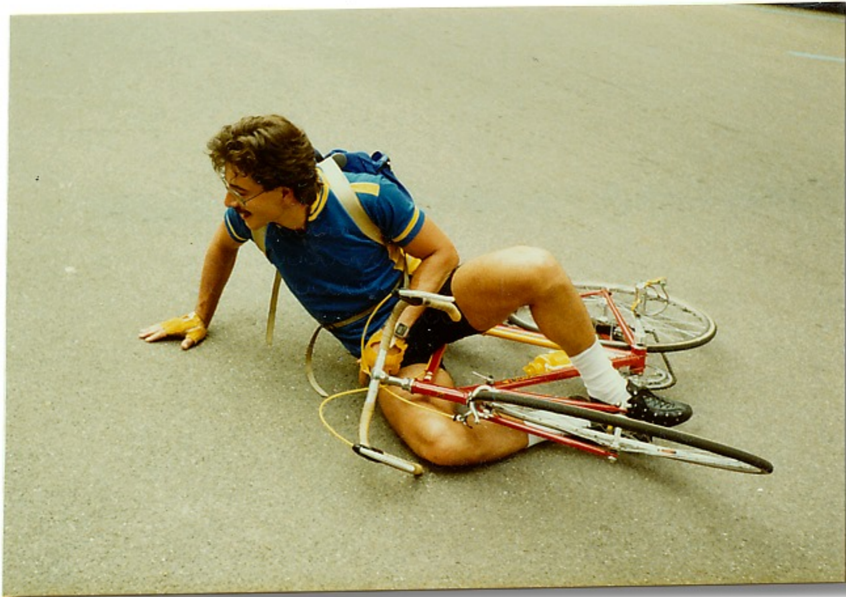
So steigt nicht jeder ab