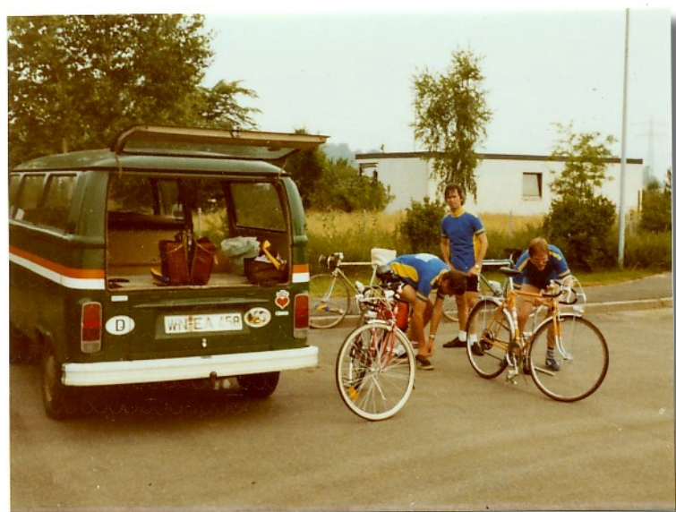
Treffpunkt Kläranlage Griesheim