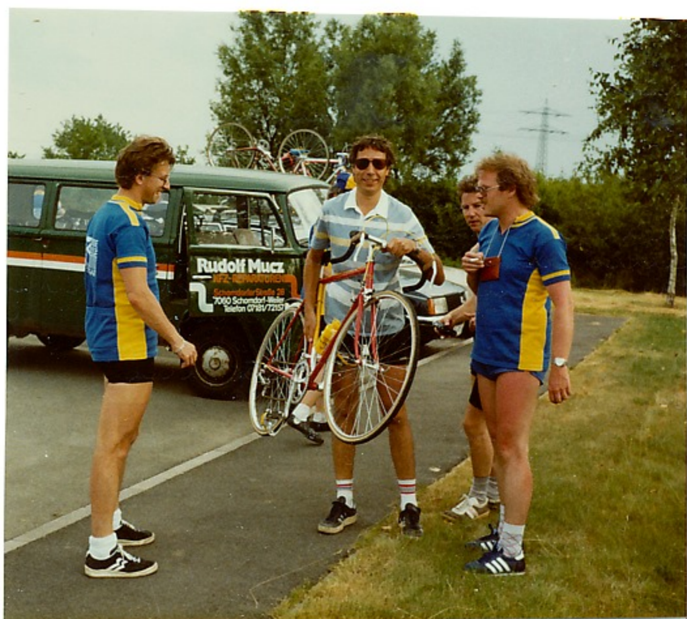
Der Gedanke zum Rennrad ist nun geboren !!!