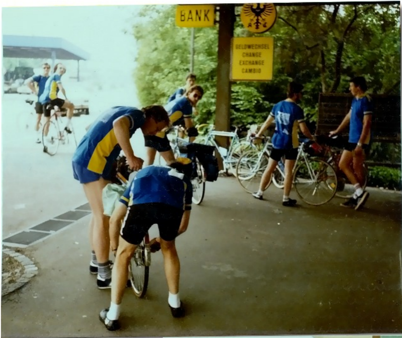
Grenzübergang nach Frankreich