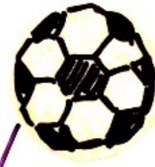
Fernsehen bis zum Herzinfarkt