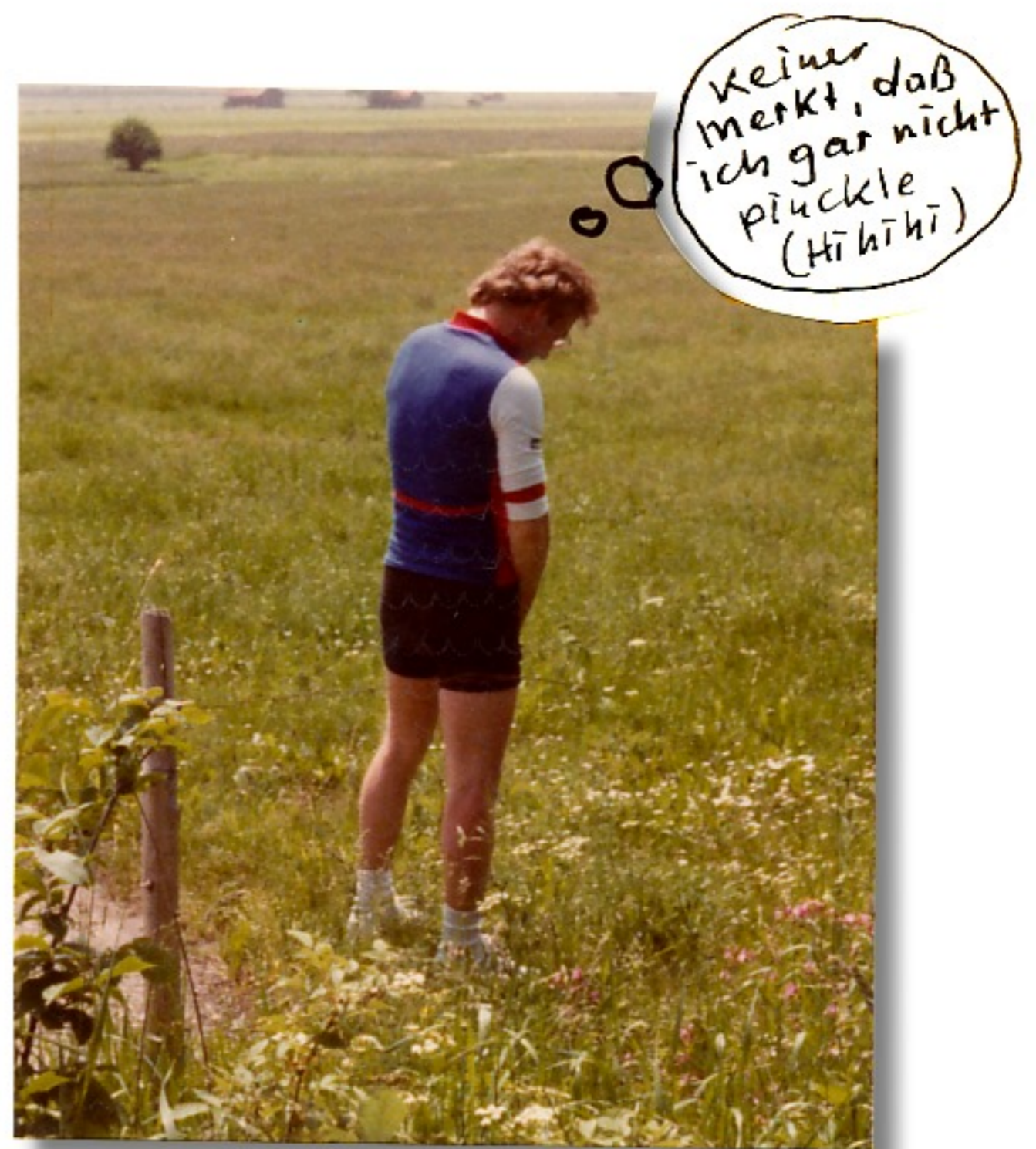
..aber ohne pinckeln auch nicht