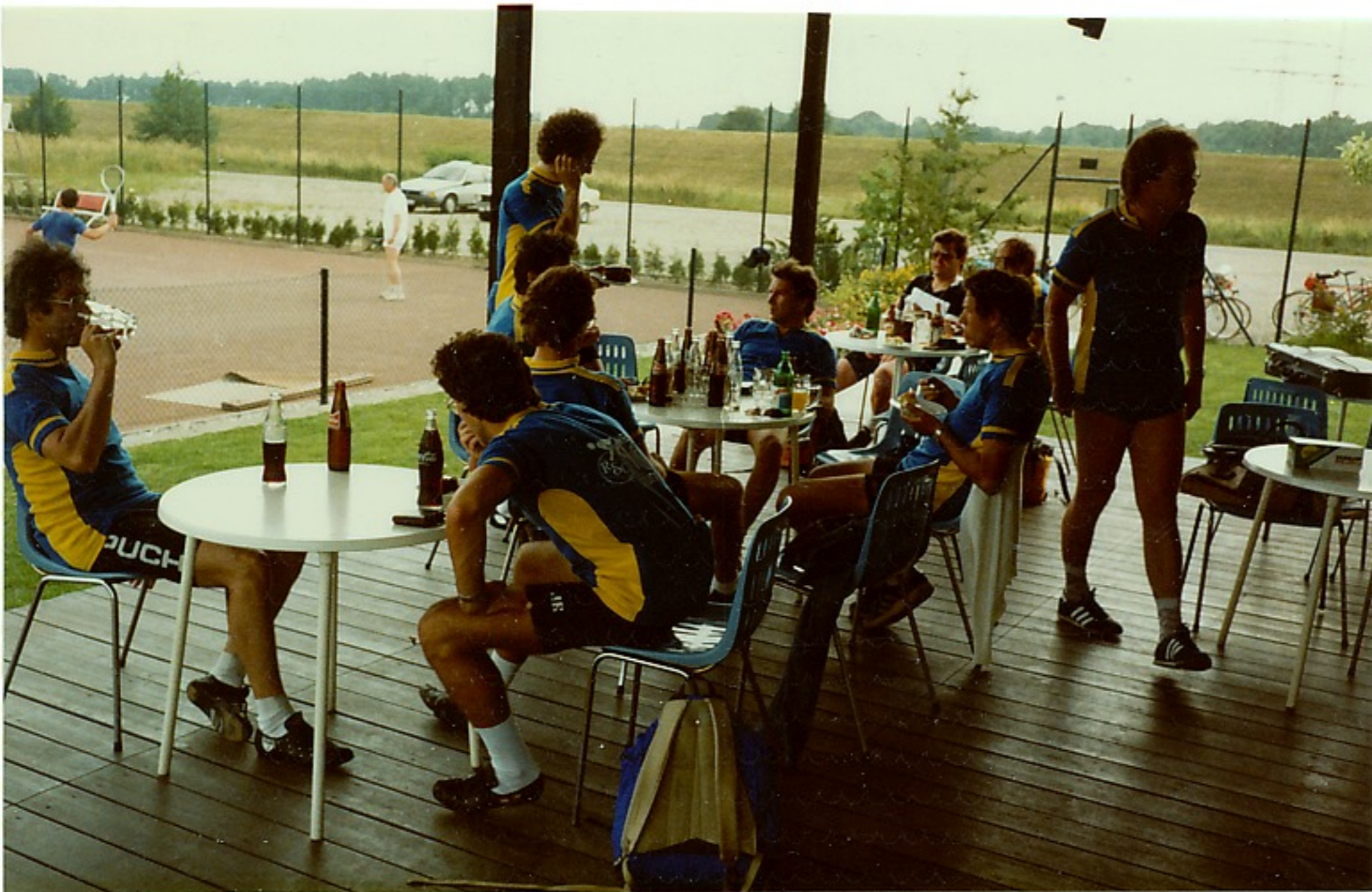
Ein paar Liter am Ende d. Tour