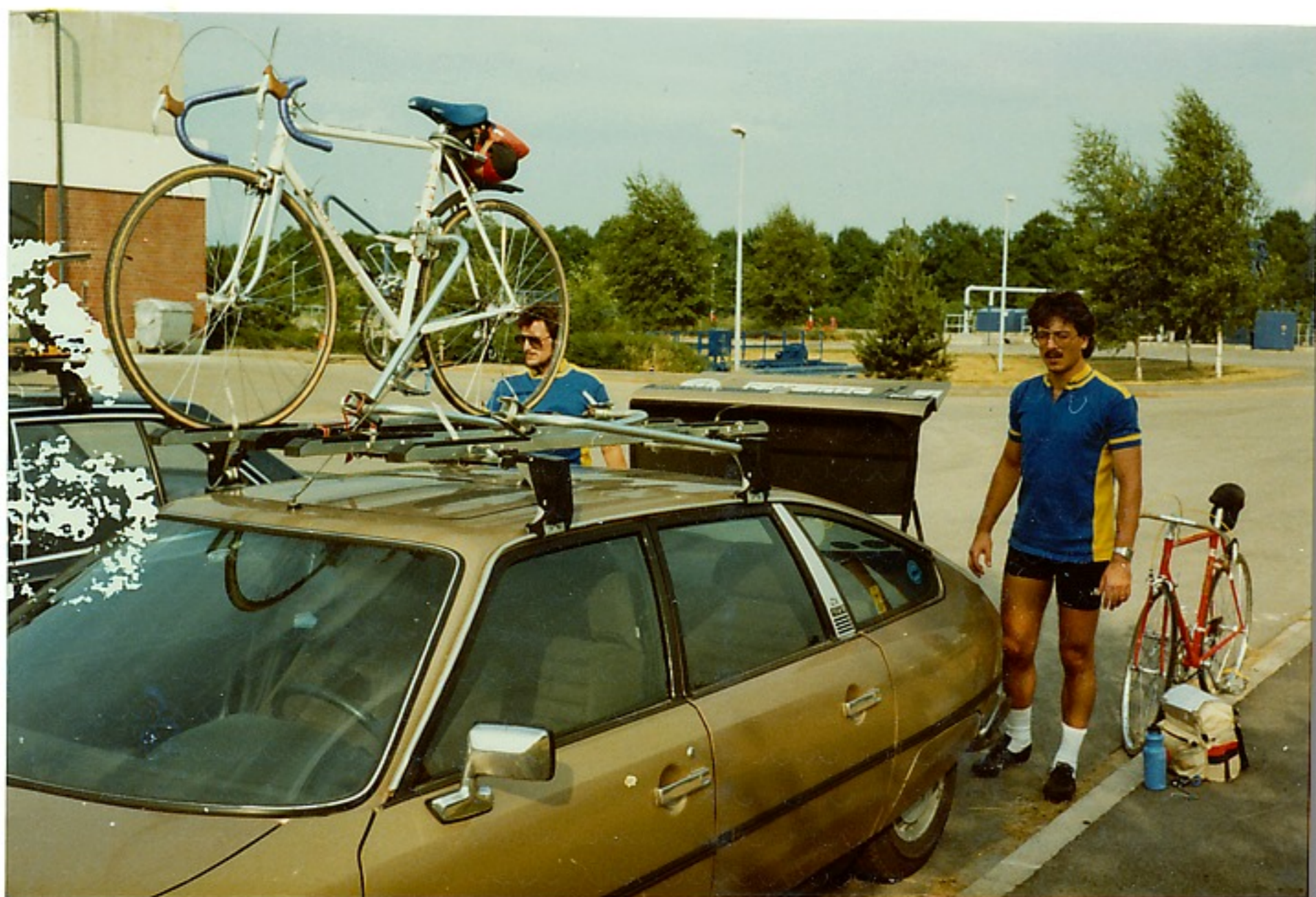
Griessheim ist wieder erreicht und Mann und Maschine wird verstaubt